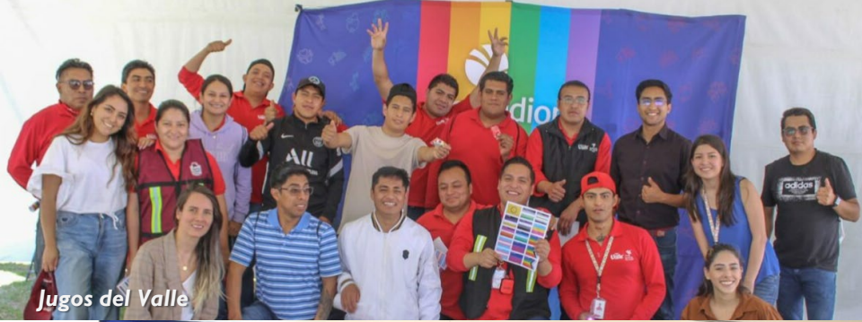
Jugos del Valle